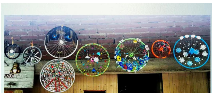
Projet En roue libre à Caraman, créations des enfants